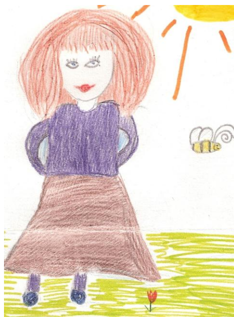
Agnese Dzene, 3.kl.