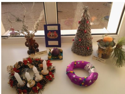
Adventa vainagu izstāde skolā.